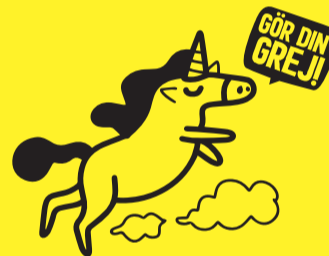
Schysst tips #4

Nätet är en plats för alla! Oavsett vem du är, vem du tycker om, vad du tror på eller hur du gör saker så ska alla få vara med. Var lika schysst mot andra som du vill att andra ska vara mot dig. Var en schysst kompis så att alla vågar göra sin grej!