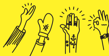
Schysst tips #2

Allt börjar med dig! Är du positiv, uppmuntrande och hjälpsam så blir det en schysst stämning. Det du skriver och gör påverkar andra. Precis som vad andra gör påverkar dig. Du har makten att skapa en schysstare stämning!