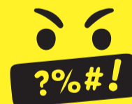
Schysst tips #6

Gör det direkt till sidan, appen eller spelet! Spara oschyssta meddelanden och ta skärmdumpar som bevis. En del nätkränkningar som till exempel olaga hot eller hets mot folkgrupp är olagliga, då ska du polisanmäla. Ingen ska få vara oschysst mot dig!